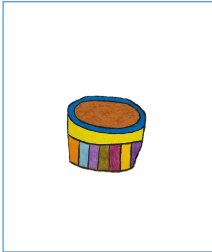
3. 在花盆上設計不同的圖案或花紋。