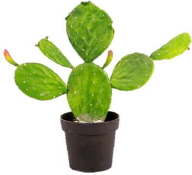
1. 仿照家中植物圖畫進行繪畫。