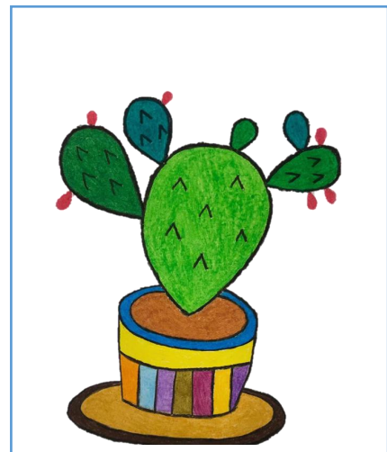
6. 最後為植物填上顏色。