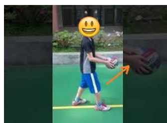
拋球方向應由下往上拋